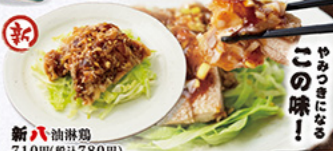
新ハ油淋鶏 710円(税込780円)