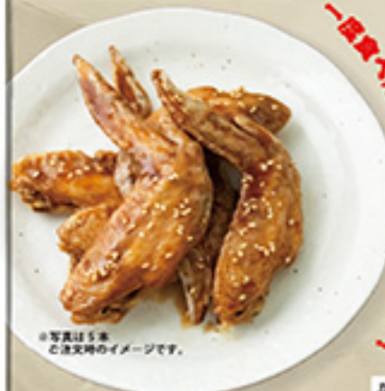
※写真は5本 ご注文時のイメージです。